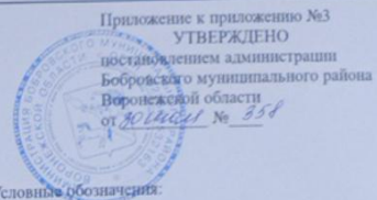
Схема прилегающей территории к БУВО "Бобровская районная больница" Липовский фельдшерско-акушерский пункт, расположенный по адресу: Воронежская область, Бобровский район, с. Липовка, ул. Мира, д. 20В, на которой запрещена продажа алкоголя.