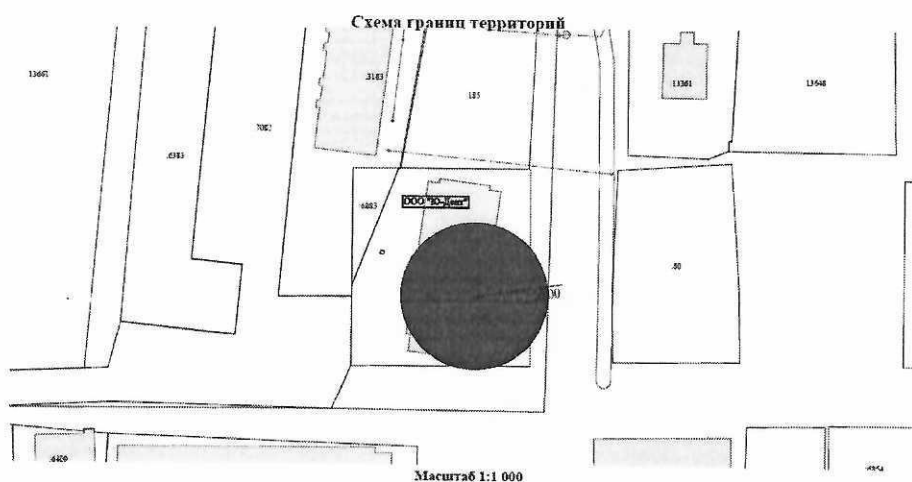
Схема границ территорий, прилегающих к обществу с ограниченной ответственностью «Ю-Дент», расположенному по адресу: Воронежская область, Новоусманский район, с. Новая Усмань, ул. Полевая, 41Б